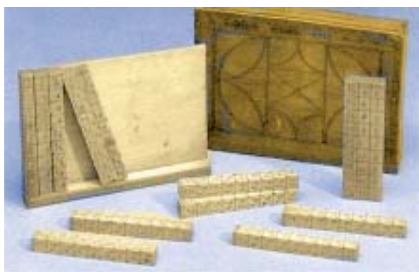
JUEGO DE HUESOS DE NAPIER DEL SIGLO XVIII EN MADERA

Los huesos de Napier se construían como un juego de diez varillas oblongas en cada una de cuyas caras laterales se inscribían las tiras de los múltiplos de los primeros nueve números. Pero se emparejaban por complementos a 9, es decir, las parejas de cada varilla sumaban 9. Por ejemplo en la quinta varilla estaban inscritos los múltiplos del 1, 2, 8 y 7. Si observas 1+7=2+8 (son complementarios). Además se inscribían invertidos: el 2 y el 1 boca arriba y el 7 y el 8 boca abajo. Estos refinamientos mejoraban su uso.