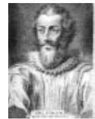
FRANCOIS "VIÈTE" (1540 - 1603)

J OHAN NAPIER no sólo creó los huesos en su interés por mejorar los procedimientos de cálculo. Más allá de los logaritmos creó una máquina de calcular que ampliaba las posibilidades de sus huesos y a la que llamó " Multiplicatio-nis Promptuarium ". Con este instrumento, Napier consiguió solucionar el principal inconveniente del uso de los huesos : al calcular con ellos, había que anotar los resultados intermedios; con el promptuario consiguió automatizar todo el cálculo algebraico. Además introdujo cambios en la notación matemática, un tema