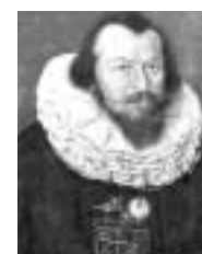
WILHELM SCHICKARD (1592 - 1635)

muy relevante en la época en la que estaba naciendo el álgebra que hoy conocemos: por primera vez Vieta utilizaba letras para representar las ecuaciones, la notación decimal -con punto y coma- empezaba a usarse, los exponentes comenzaban a causar preocupación entre los matemáticos. Napier además recopiló la trigonometría de su tiempo, especialmente la trigonometría esférica. Schickard desarrolló las ideas de los huesos inventando la primera máquina automática que realizaba cuarto operaciones.