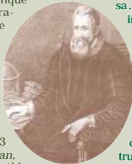
JOHN NAPIER (1550 - 1619)

J OHAN NAPIER (1550- 1619) Barón de Merchiston, una localidad cercana a Edimburgo, la capital de Escocia. Su padre Archibald Napier fue un noble muy importante en su época. Ingresó en la Universidad de Saint Andrews -una de las más antiguas del Reino Unido- aunque no llegó a finalizar su graduación, marchando de viaje por Europa. Aunque es conocido por sus contribuciones a las matemáticas, su profundo sentido religioso le convirtió en un protestante ferviente preocupado principalmente por la teología. Su libro de 1593